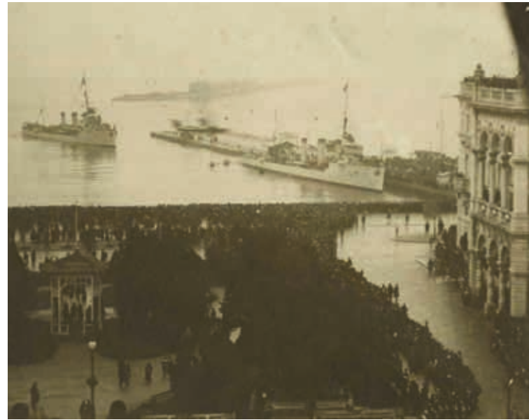
Trieste, 3 novembre 1918.

La fine del conflitto segna la definitiva sconfitta del programma genocida di Francesco Giuseppe: nonostante il suo editto, nonostante decenni di politica asburgica in chiave antitaliana e pro slavizzazione, nonostante tutto ciò la presenza italiana in