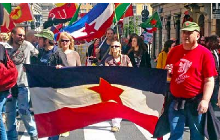
La stella rossa di Tito in Piazza Unità: un'offesa per gli Italiani, ma anche per gli Sloveni.

Era dal tempo degli Asburgo che era emerso il bisogno di una loro identità nazionale, diversa e distinta dalla semplice fedeltà all'Impero. La fine dell'Austria-Ungheria, la fine della guerra avevano accelerato tale processo, ma era rimasto imbrigliato nell'egemonia dei Karageorgevich. Prima il Regno Serbo, Croato, Sloveno, poi il Regno di Jugoslavia erano entrambe realtà belgradocentriche, nelle quali erano i Serbi a farla da padro-