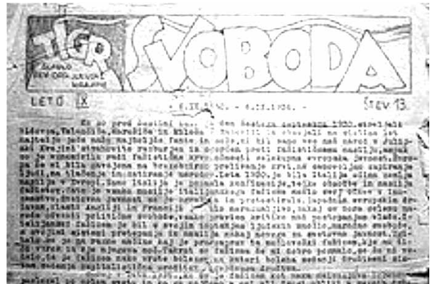
TIGR - L'organo dei terroristi jugoslavisti.

Cancellato, per fallimento, il progetto asburgico sono però rimasti i suoi effetti più negativi e cioè l'aver fatto nascere e poi l'aver alimentato la conflittualità tra i due gruppi etnici, Italiani e Sloveni.