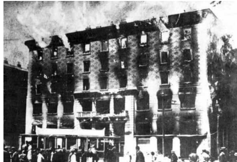
L'hotel Balkan in fiamme.

Partiamo da un dato, anzi da una data: 12 novembre 1866, quando «Sua Maestà (Francesco Giuseppe) ha espresso il preciso ordine che si agisca in modo deciso contro l'influenza degli elementi italiani ancora presenti in alcune regioni della Corona e si operi... in Dalmazia e nel Litorale (Trieste e l'Istria) per... la slavizzazione di detti territori a seconda delle circostanze, con energia e senza riguardo alcuno».