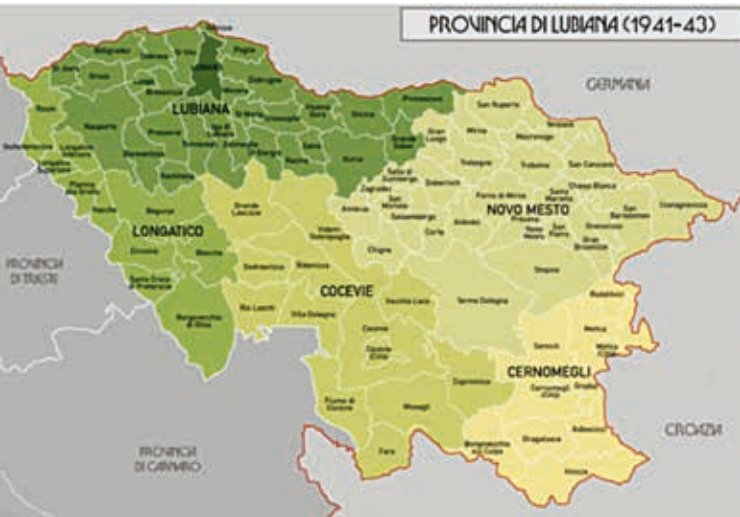
Provincia di Lubiana - Ljubljanska Pokrajina.

vamente assumendo un ruolo sempre più di rilievo e infine ottenendo l'investitura a leader di quella guerra, prima da parte di Churchill, poi da Stalin.