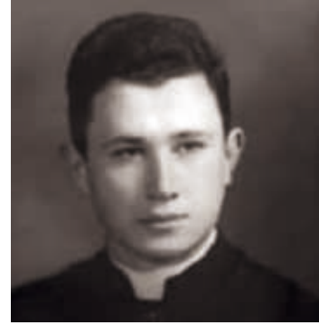
Beato Miroslav Bulesic.

rato e poi lasciato cadavere nel bosco di Mirna: naturalmente perchè «nemico del popolo».