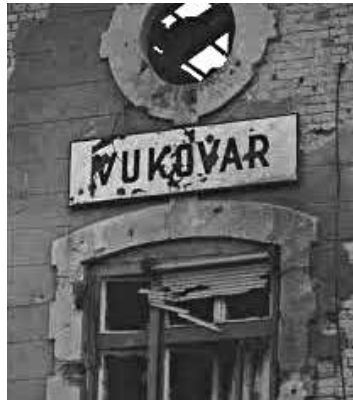
Vukovar occupata dai croati.

Il presidente federale Mesic ha invitato i militari di leva alla diserzione in quanto l'esercito non rispecchia più l'origine federale ma a tutti gli effetti è un esercito serbo.