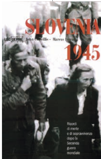
Slovenia 1945 - documento del martirio sloveno.

Per noi era una convinzione generale, incontestabile: la Jugoslavia era la patria degli Sloveni, con essa si identificavano, erano orgogliosi dei suoi successi e comunque Josip Broz