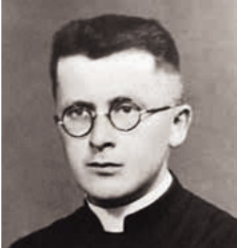
Beato Francesco Bonifacio.