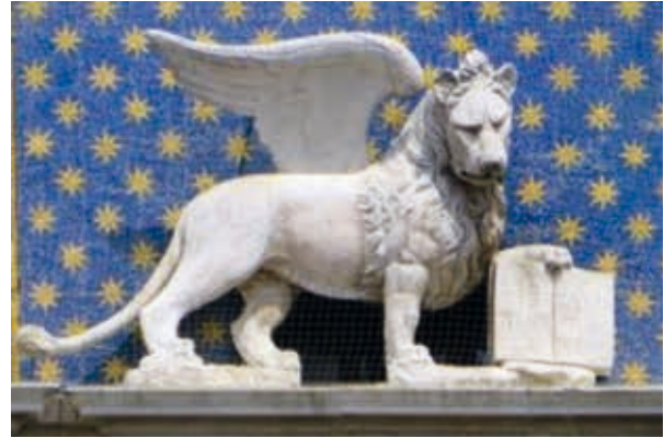
25 aprile: festa di San Marco.

Sarei lì a rendere testimonianza alla civiltà contro la barbarie. Sarei lì anch'io, come tutti gli altri, a perdonare ma non a dimenticare. Perché non si possono dimenticare gli