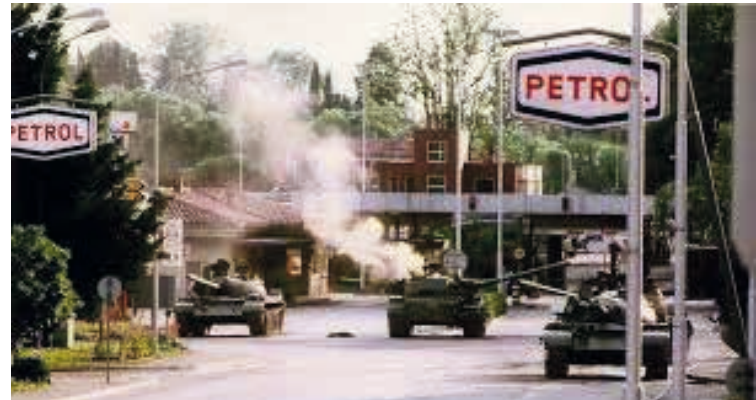
Immagini della guerra di liberazione dalla Jugoslavia.

Ma neppure la Croazia è scevra dai nazionalismi. Sarà il capo del locale partito comunista croato, a diventare il più acerrimo avversario di Reihl Kir, reo della sua politica di distensione.