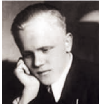
Beato Lojze Grozde.