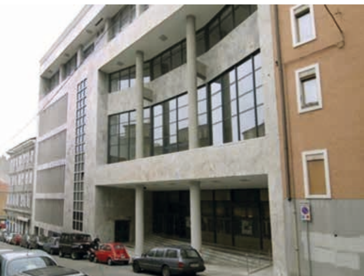
Il teatro sloveno.