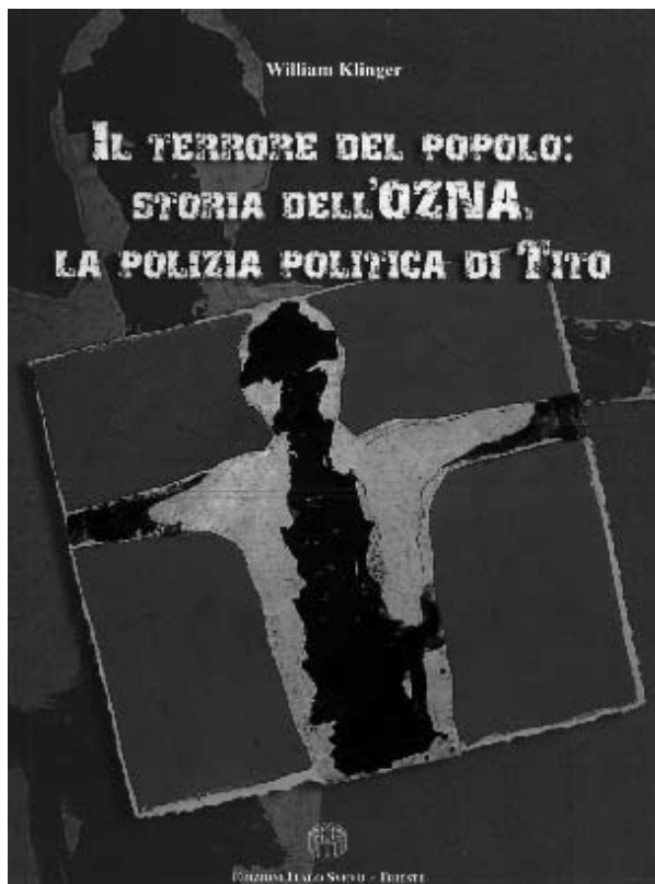
La copertina della prima edizione.

In Slovenia un "Servizio sicurezza e informazioni" (Varnostno obvescevalna sluzba VOS) fu costruito, in completa autonomia da Tito, prima ancora di organizzare le prime unità partigiane combattenti. Il VOS sloveno stupisce per la completezza ed efficacia del suo apparato di intelligence e repressione che, a detta dei suoi stessi appartenenti, aveva come obbiettivo principale la neutralizzazione della resistenza antifascista non comunista slovena. Il movimento di resistenza sloveno fu organizzato seguendo pedissequamente le direttive del Comintern come un "Fronte Popolare" (l'Osvobodilna Fronta), dove i comunisti detenevano il controllo dell'apparato repressivo e informativo. Anche Tito ubbidì a Mosca quando nell'autunno del 1941 si recò ad Uzice per incontrarsi con Mihailovic offrendogli la sua collaborazione. Tito fu pronto a cedere a Mihailovic il comando militare dei partigiani ma in cambio pretese il monopolio politico che doveva spettare ai comunisti. Dopo il rifiuto di Mihailovic e l'inizio delle ostilità a tutto campo tra le sue formazioni etniche e quelle partigiane, Tito fu costretto a cambiare strategia e tat-