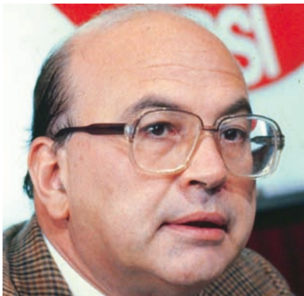
...smantellamento del sistema politico italiano che dapprima si abbatté contro il PSI e il suo leader Craxi...

A ben vedere un trattamento simile è stato riservato anche all'altro alleato adriatico. Dopo il 1993 (forse con il concorso americano) si procedette allo smantellamento del sistema politico italiano che dapprima si abbatté contro il PSI e il suo leader Craxi e poi alla DC. Nelle nuove elezioni amministrative del 6 giugno 1993