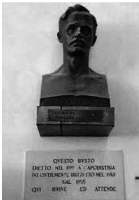
... una copia del busto è stata posta nel Liceo Danta Alighieri, a Trieste, nel 1955.

Come Gambini, altri numerosi giuliano-dalmati lasciano la propria terra e si arruolano poi nell'Esercito italiano. Essi fanno tale scelta pur nella consapevolezza che rischiano l'impiccagione nel caso vengano fatti prigionieri