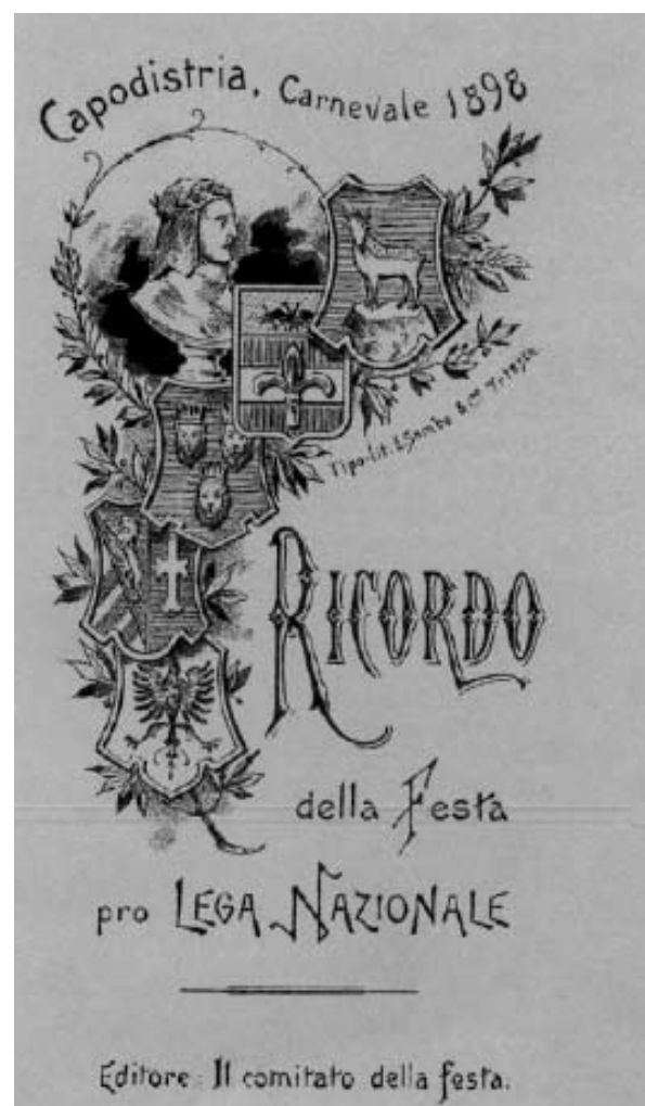
Ricordo della Festa Pro Lega Nazionale, Capodistria, Carnevale 1898 (archivio Lega Nazionale).

(intervento tenuto presso il Liceo Dante Alighieri)