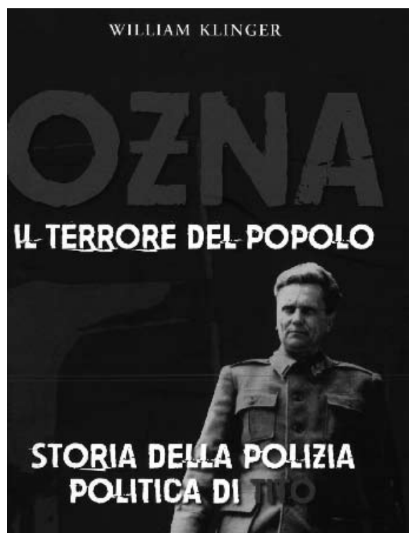
La terza edizione, distribuita in allegato a sei quotidiani del nord-est.

I metodi sviluppati e perfezionati in Bosnia nel corso della "lunga marcia" del 1942 serviranno a Tito per subordinare la dirigenza del partito sloveno che fino a quel momento operava in so-